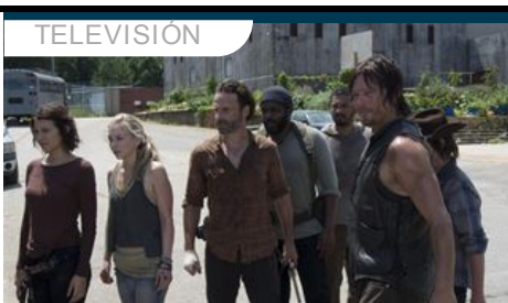
El regreso de The Walking Dead ya tiene fecha