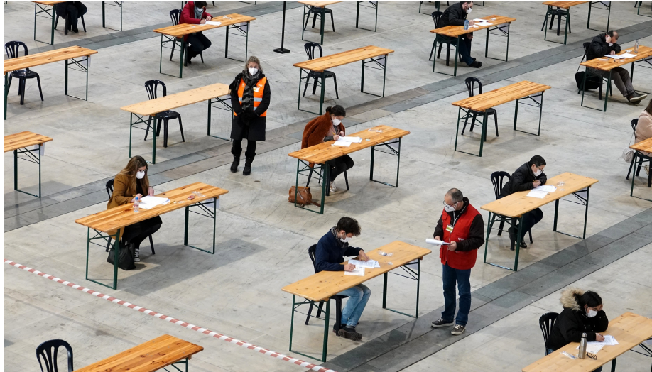
Oposiciones a la Policía

Confidencial Digital | 26 de marzo de 2021