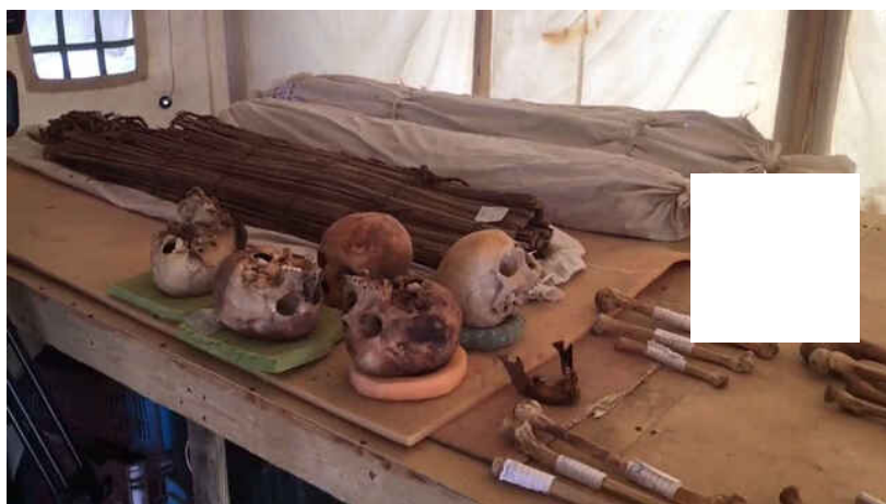
Nuevos hallazgos arqueológicos en Saqqara