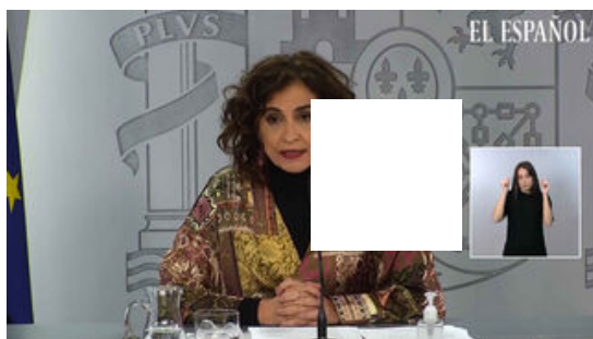
El Gobierno declara a ocho CCAA afectadas por...