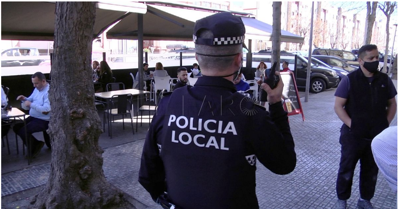
Imagen de archivo Imagen de archivo