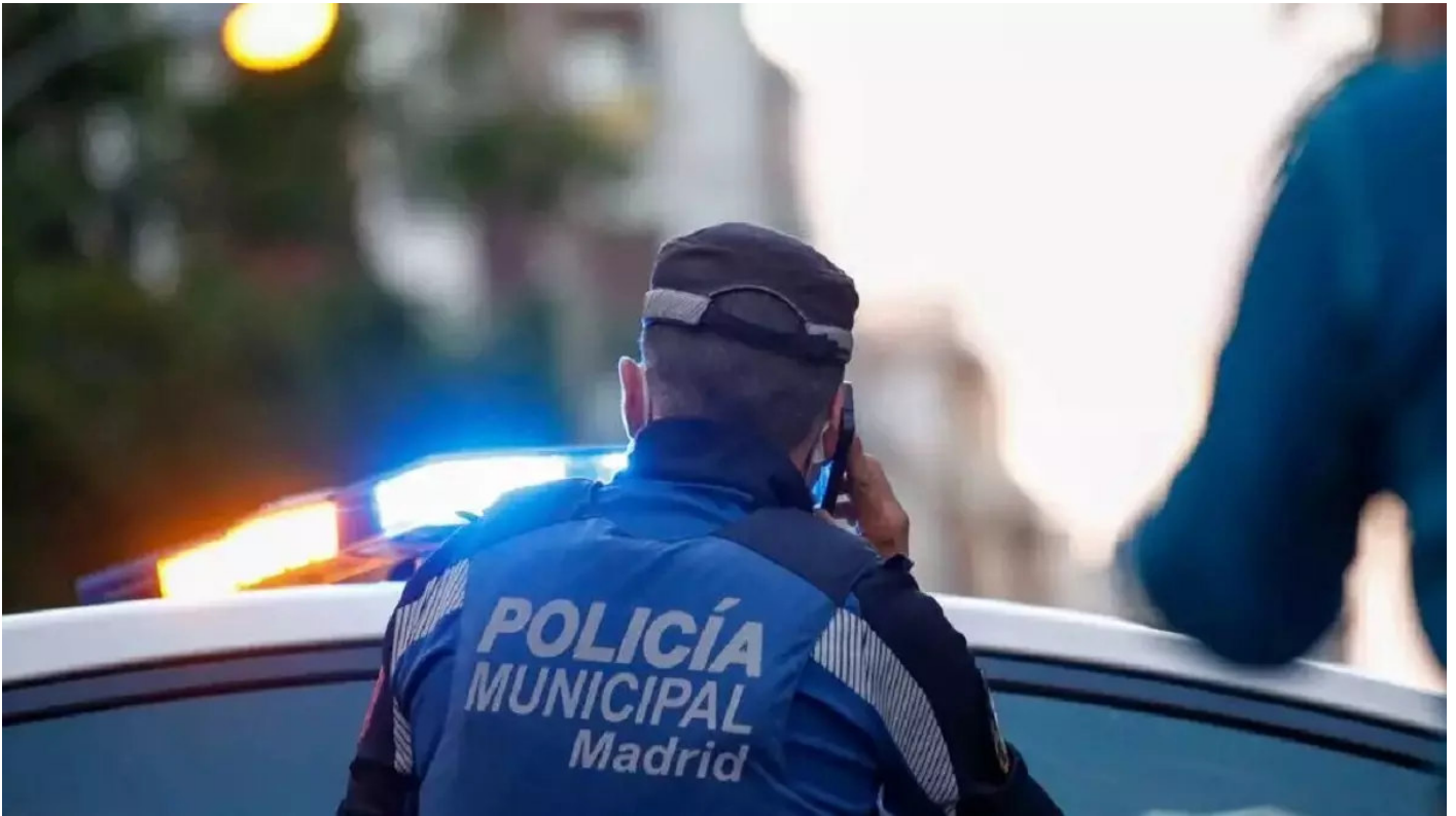
Imagen de archivo de un policía municipal de Madrid.

Un juez cambia la puntuación a un opositor a la Policía Municipal de Madrid porque el Consistorio no explicó correctamente la forma de calificar una de las pruebas