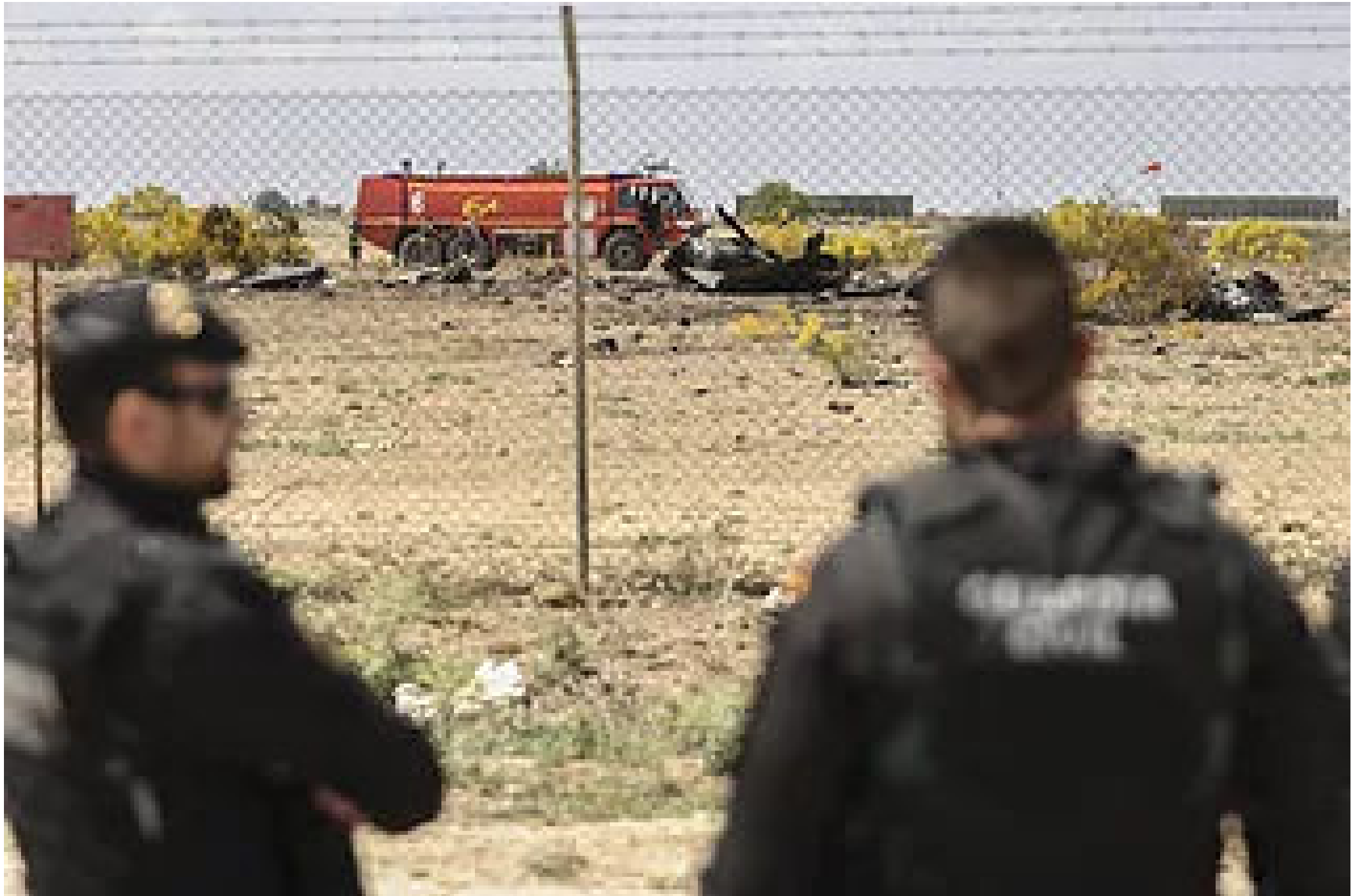
Agentes de la Guardia Civil, junto a un accidente.