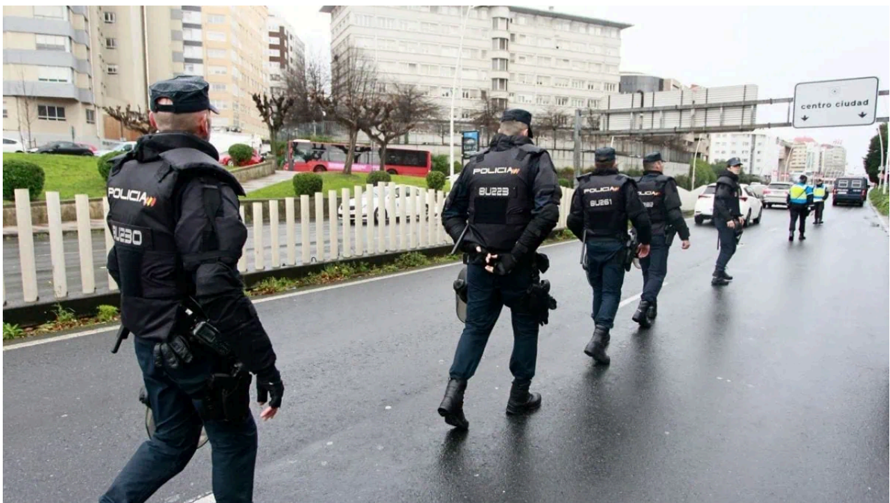
Grupo de policías.

El TS condena a Interior a repetir el psicotécnico a una aspirante tras haber evaluado con notas de corte distintas