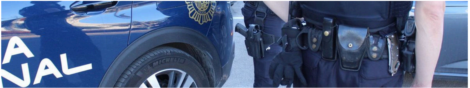
Imagen de archivo de agentes de la Policía Nacional