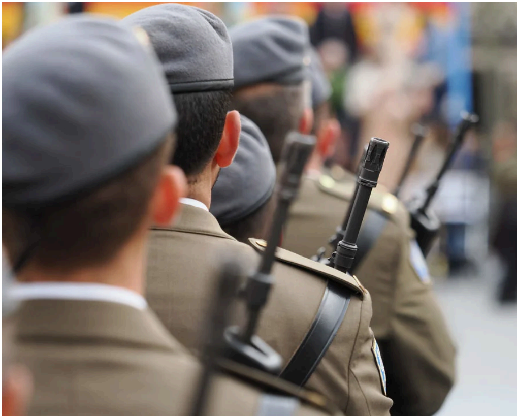
Militares del Ejército de Tierra.

Los militares recibieron hoy la carta del Ministerio de Defensa diciéndoles que debían abandonar su vivienda con todas sus pertenencias antes del 30 de septiembre . En el documento, al que ha tenido acceso Confidencial Digital , se especifica que “Con motivo de la falta de disponibilidad de alojamientos en la Residencia Militar de la Base Aérea de Torrejón, y ante el incremento de solicitudes denegadas de alojamiento producidas en los últimos meses, el Negociado de Alojamientos ha decidido optimizar los recursos para favorecer la movilidad geográfica de los militares en servicio activo destinados en la Base Aérea de Torrejón”.