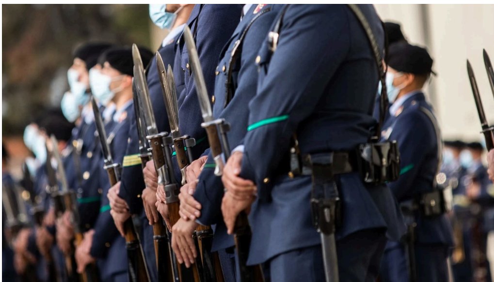
Militares del Ejército del Aire.

El Ejército del Aire alega que trata de optimizar las plazas para favorecer la movilidad geográfica de los miembros de las Fuerzas Armadas